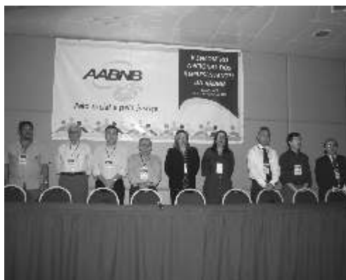
Mesa de abertura do Encontro