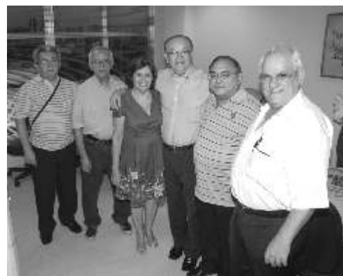
Representantes visitam a sede da AABNB