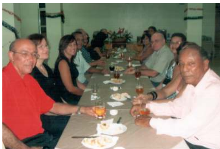
Festa de natal da Representação de Itabuna