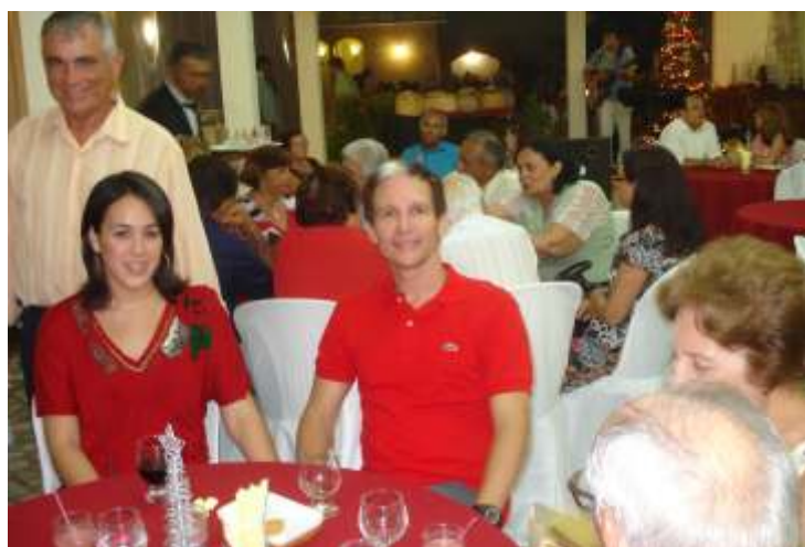
Dois momentos da confraternização natalina da Representação de Natal