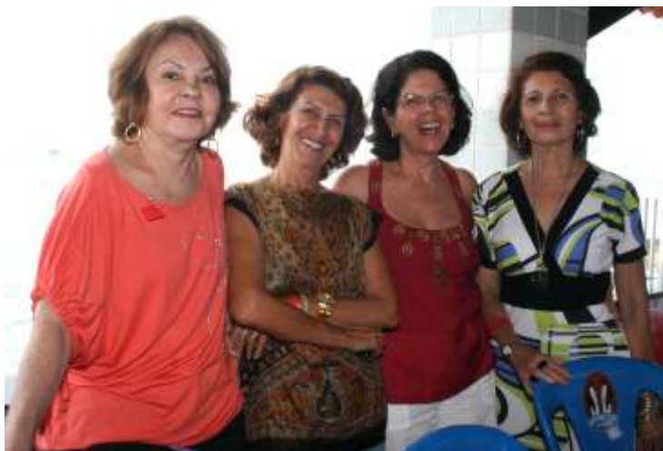
Participação feminina na festa de natal da Representação de Salvador