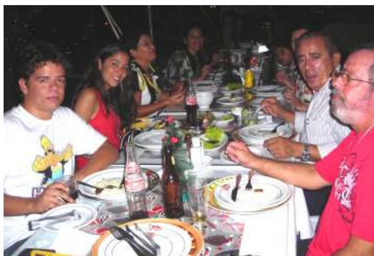
Confraternização de natal da Representação de Ilhéus