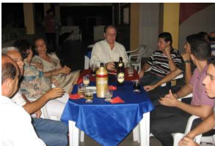
Confraternização de natal da Representação de Januária