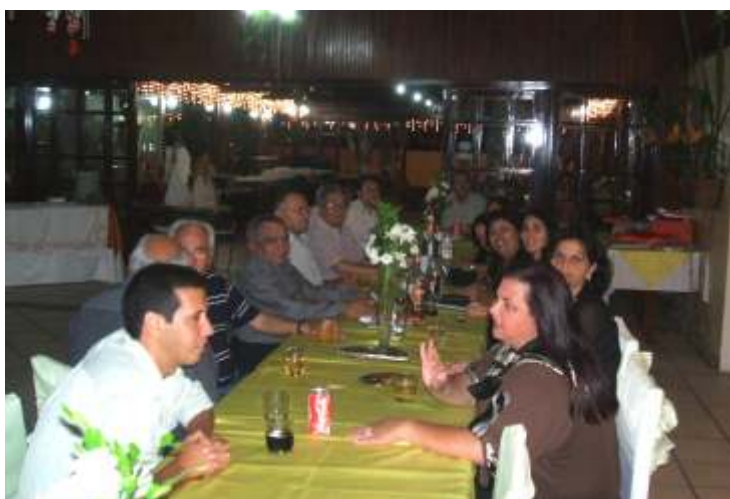
Confraternização de natal da Representação de Garanhuns