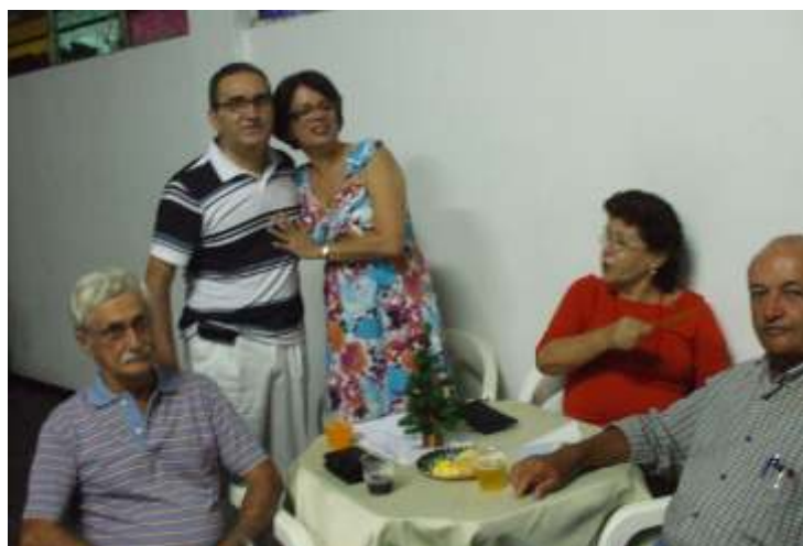
Confraternização de natal da Representação de Feira de Santana