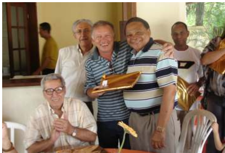
Confraternização natalina da Representação de Belo Horizonte