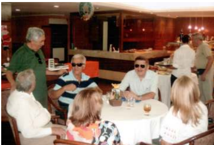
Festa de natal da Representação de João Pessoa