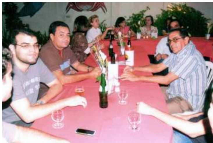
Festa de natal da Representação de Parnaíba