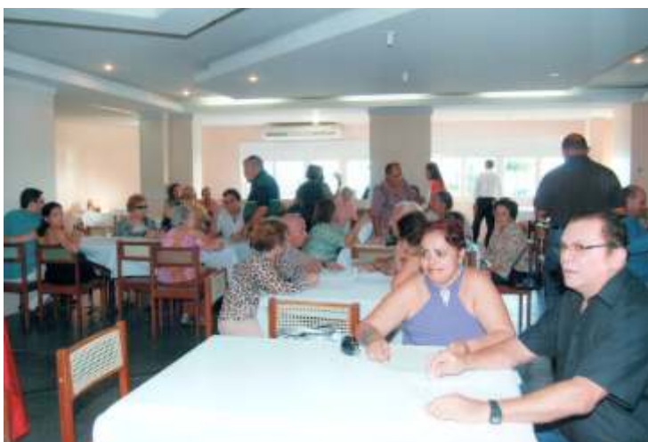
A Representação de Maceió comemorou no restaurante do Clube Fenix